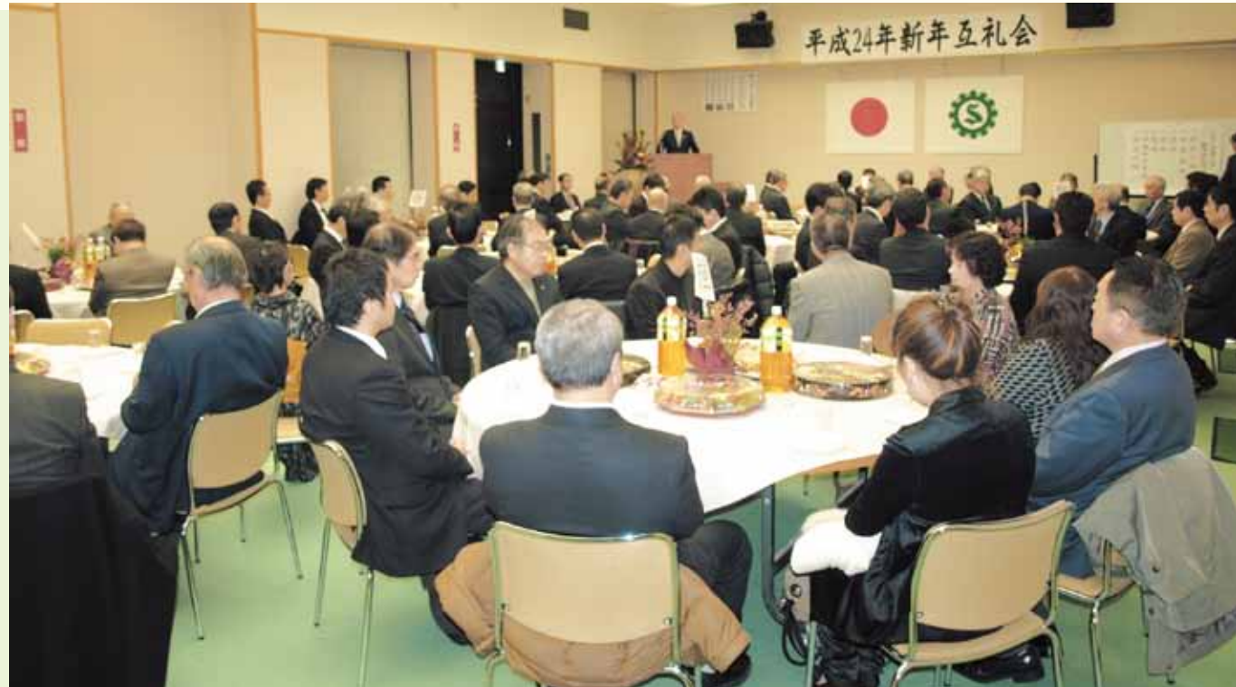
平成24年新年互礼会

〈編集・発行〉かほく市商工会 かほく市高松ク42番地1 TEL 076-282-5661 FAX 076-282-5663